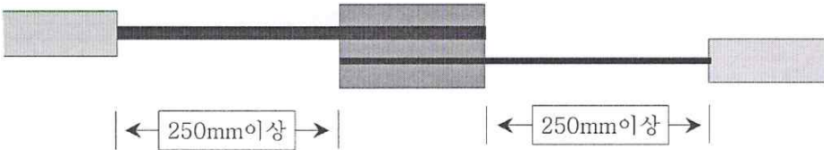
[그림1-2] 접속저항 시험