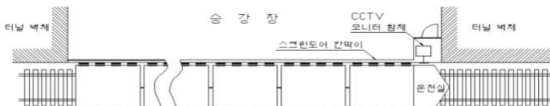
그림.1 광역철도 승강장 영상감시(CCTV) 설치 구성도

(다) 승강장 여유길이가 1m 이하인 역사의 승강장 영상감시모니터 설치 위치는 그림 1과 같다.