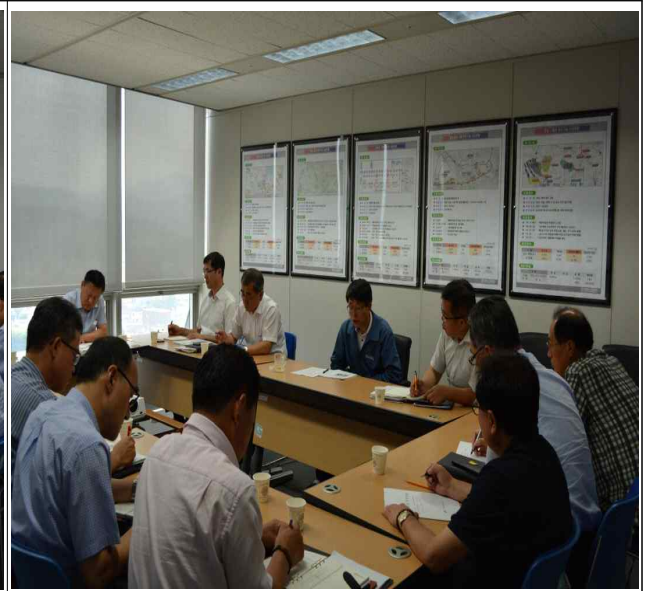
충청본부 윤리실천단회의 (10층회의실)