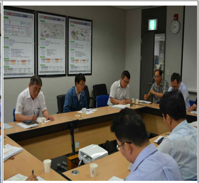
충청본부 윤리실천단회의 (10층회의실)