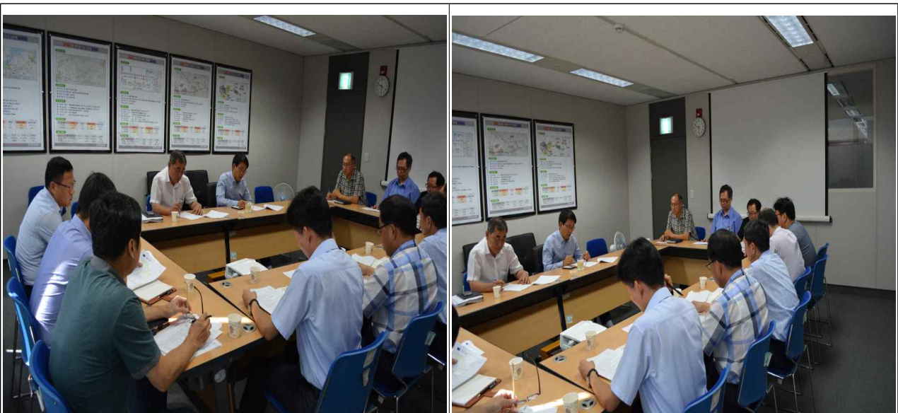
충청본부 윤리실천단회의 (10층회의실)