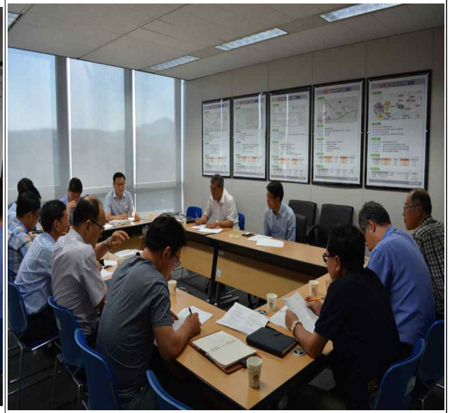
충청본부 윤리실천단회의 (10층회의실)