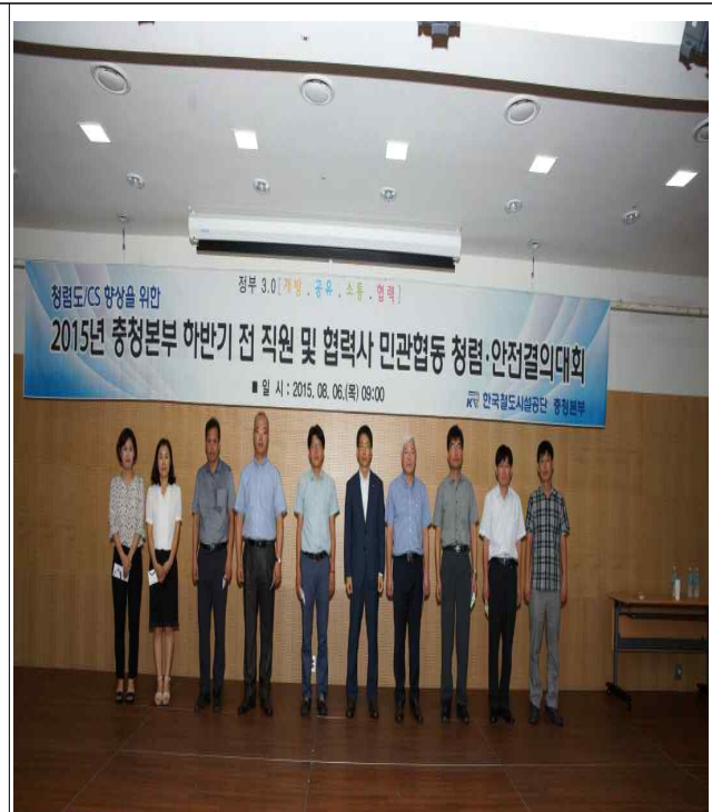
청렴 및 CS우수, 창의혁신 등 직원 표창