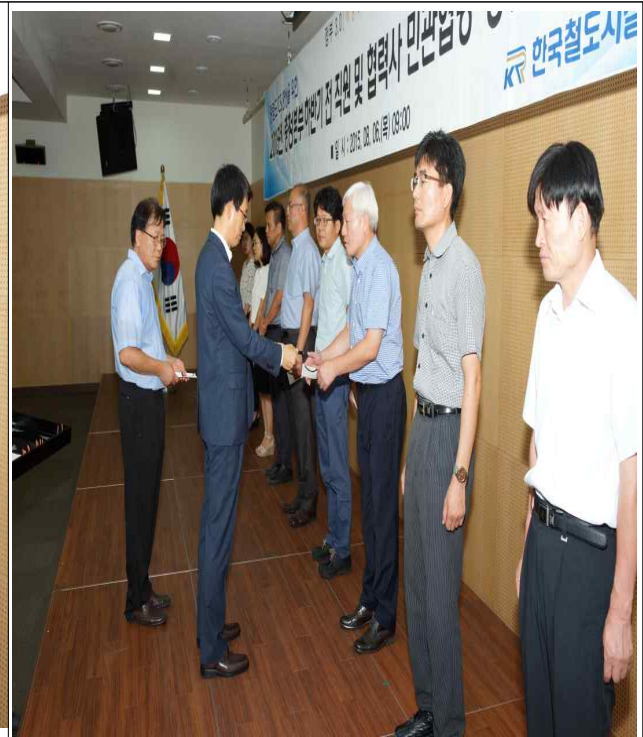
청렴 및 CS우수, 창의혁신 등 직원 표창