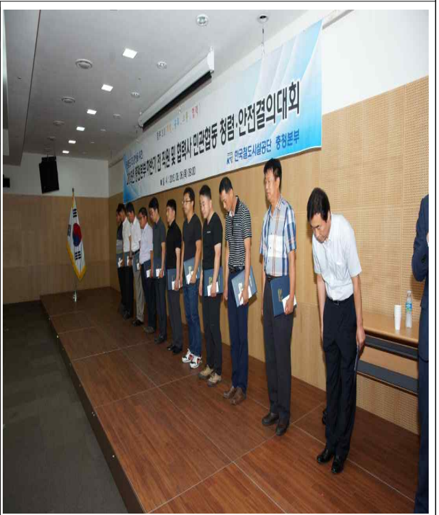
충청본부 관내 현장 최우수 근로자 표창