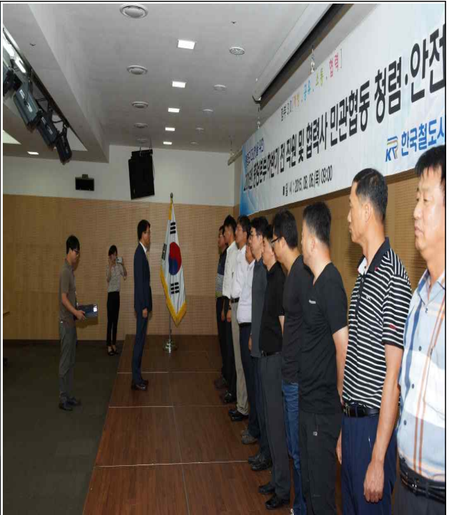
충청본부 관내 현장 최우수 근로자 표창