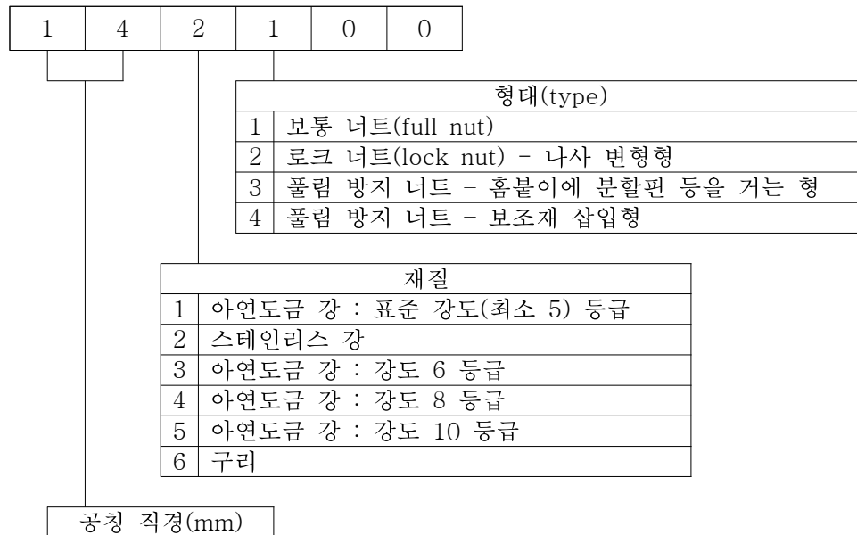
[그림 1] 분류기준