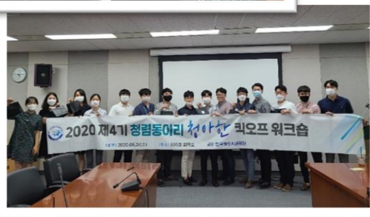
2020. 6.24. 제4기 '청아한' 킥오프 워크숍