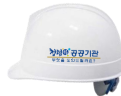
(측면) 청렴한 공공기관