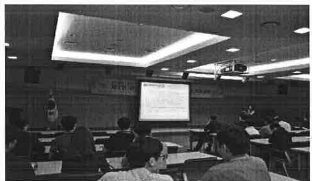
‘16년 부서평가 공통평가지표 공유