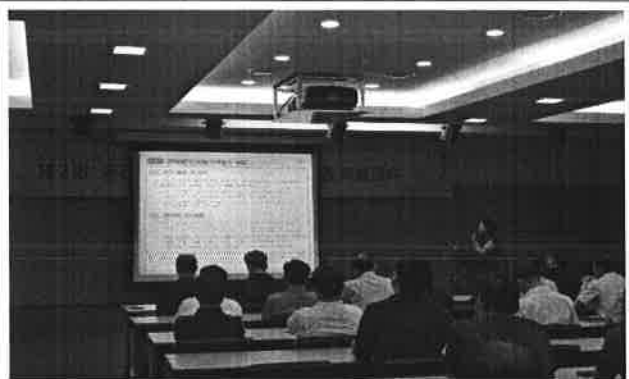
‘16년 반부패 시책평가 추진계획 및 실적 공유