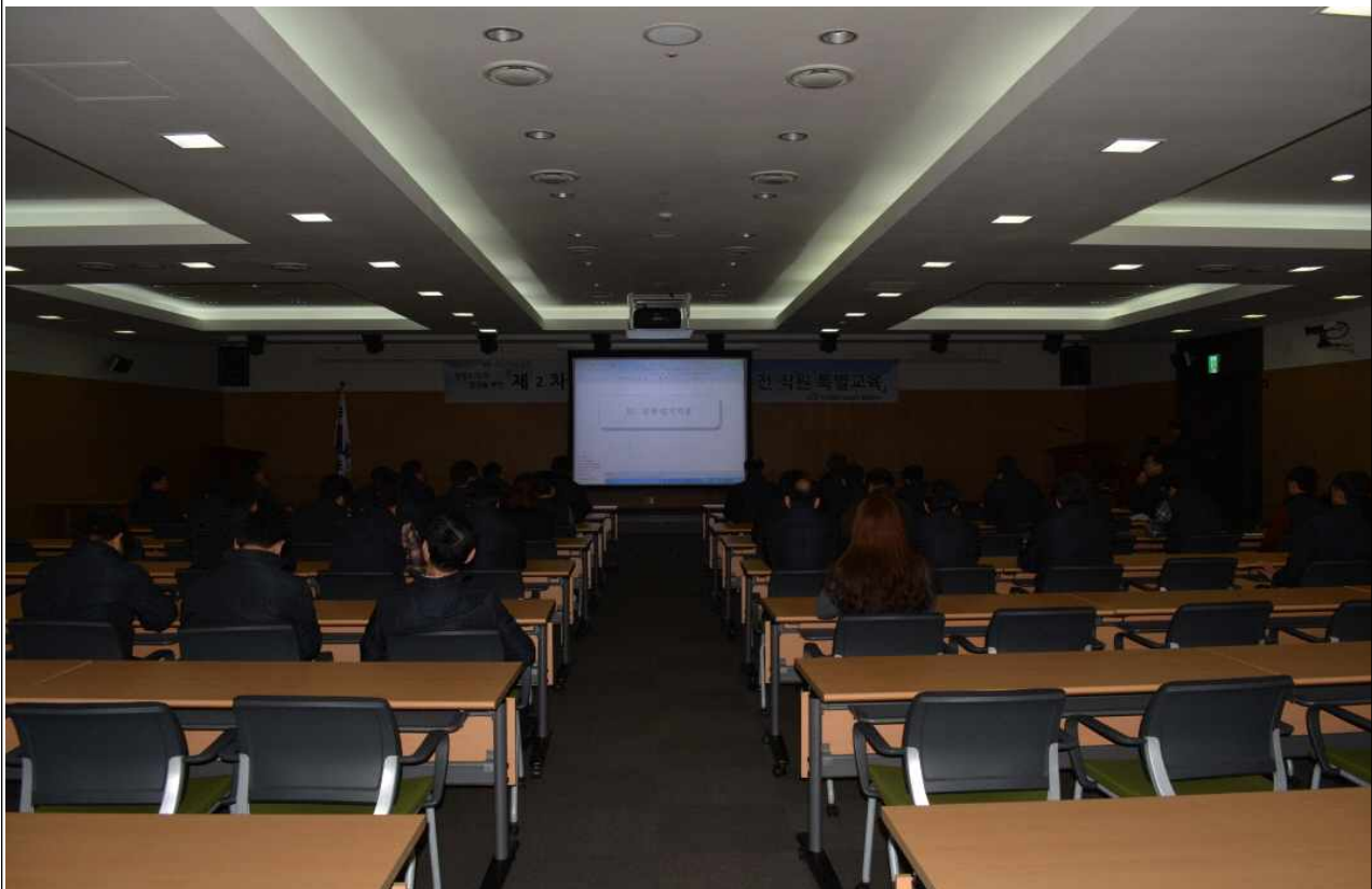
공통지표 및 청렴 고객만족 향상 등 교육