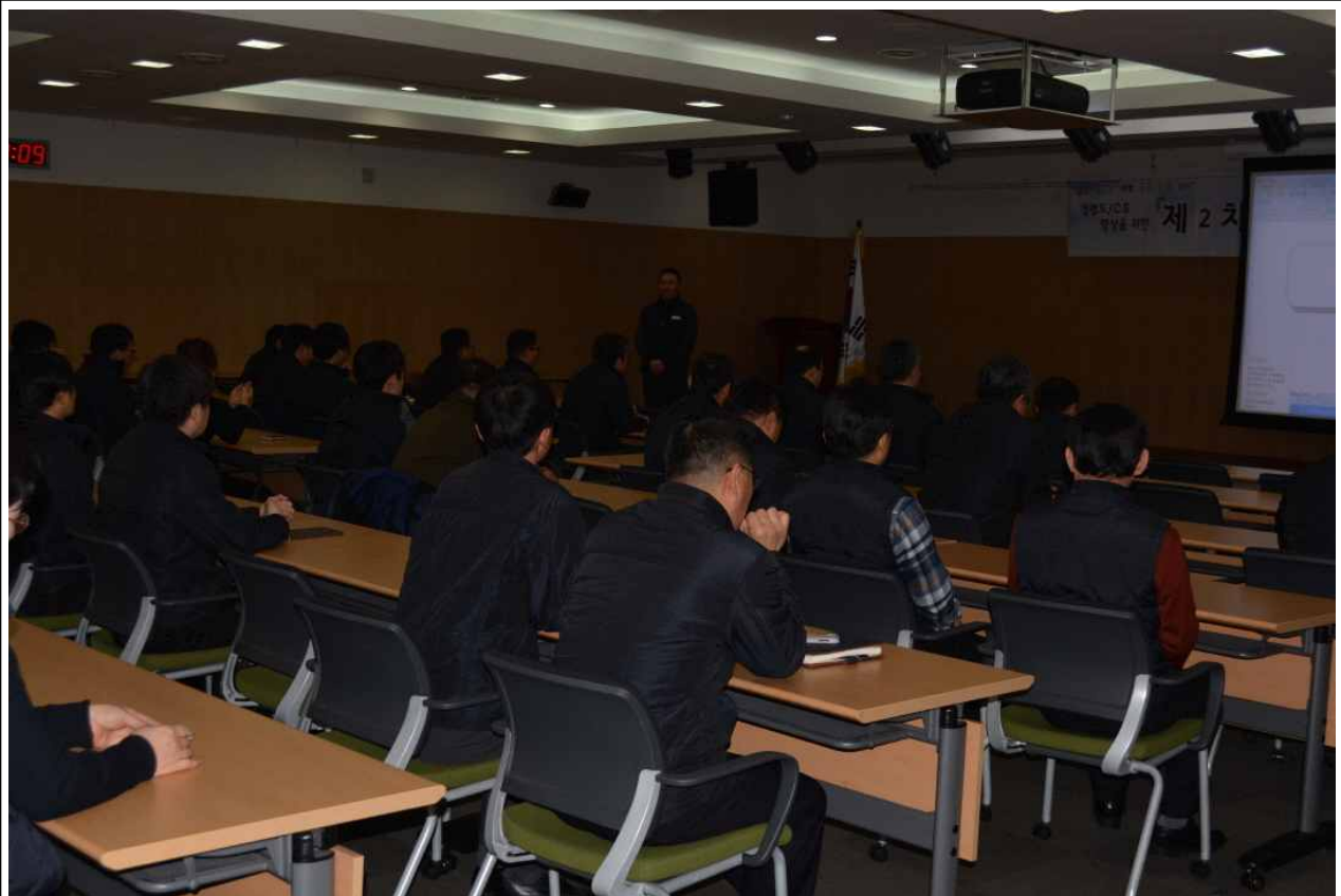
충청본부 전입직원 소개