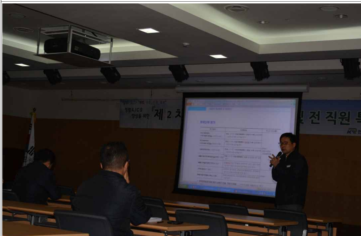
건설사업관리 개선 및 향상방안 교육