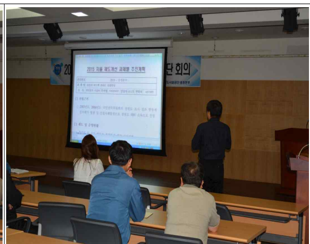
자율적 청렴제도개선과제 추진계획 발표