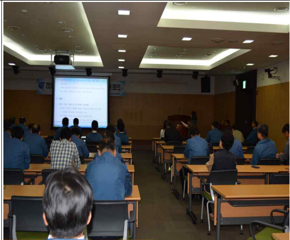
자율적 청렴제도개선과제 추진계획 발표