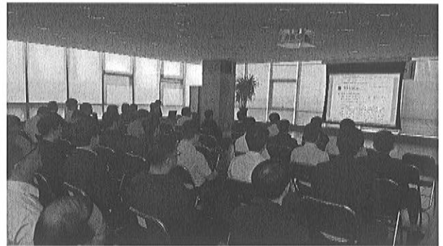
부패방지 청렴 추진계획 설명