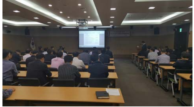
부패방지 청렴 추진실적 보고