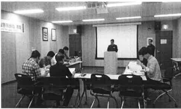
윤리실천단 · CS경영단장 인사말씀