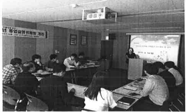
청렴 · 지식 · CS계획 및 실적 공유