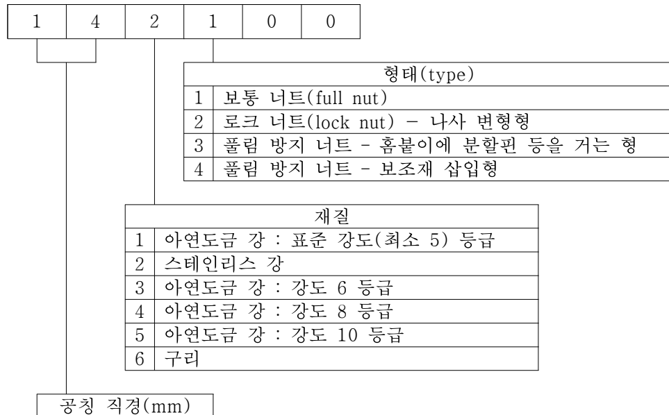
[그림 1] 분류기준

너트에 대하여 재질과 타입, 치수별로 특성을 명확히 식별하여 부르기 위하여 6자리 된 번호부여 체계를 도입하여 호칭하며, 각 자리수에 대한 설명은 [그림 1]과 같다.