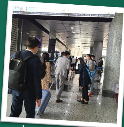
출근길 청렴송편 나눔