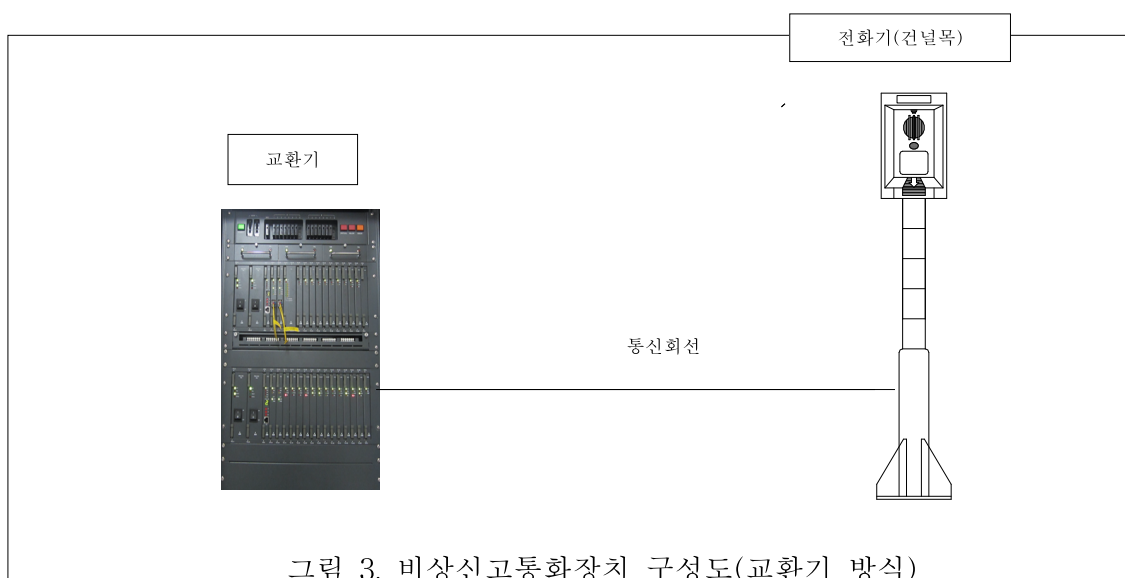
그림 3. 비상신교통화장치 구성도(교환기 방식)