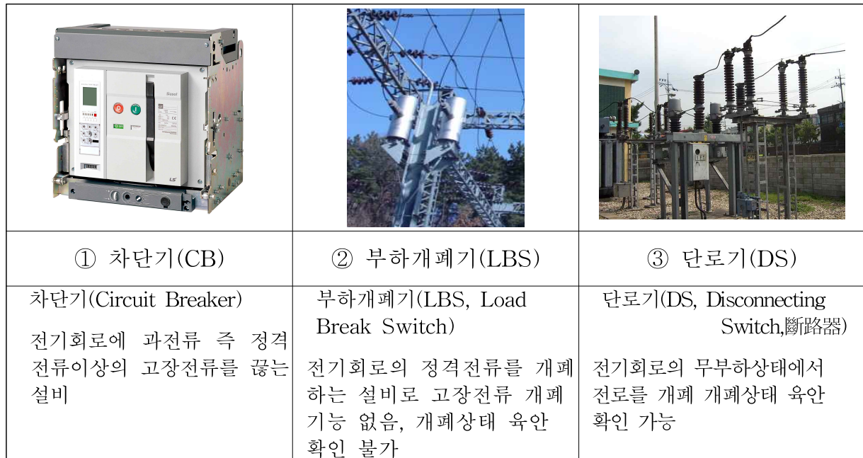
[각 개폐기 사진]

즉, 인출개소에 설치하는 개폐기(단로기)의 핵심목적은 GIS 점검보수 및 고장, 전차선로 급전케이블 고장시 선로를 전기적, 기계적으로 완전 분리하여 점검보수시 안전을 확보하고 열차의 비상운전이 가능하도록 하는 설비임.