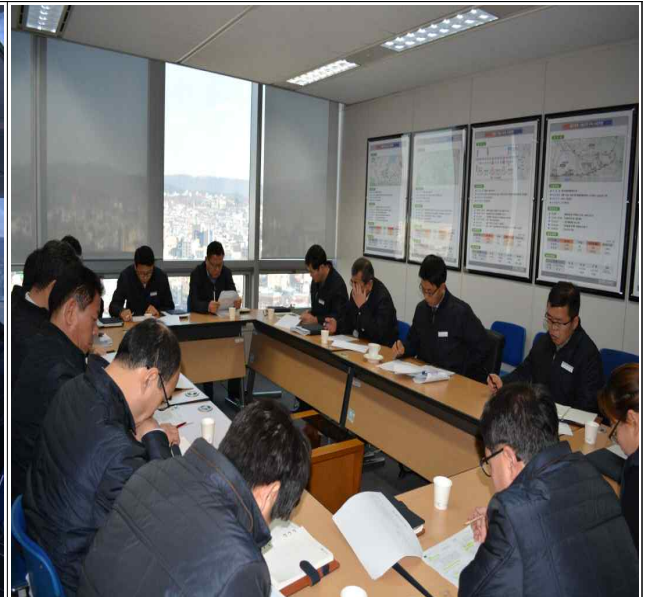
충청본부 윤리실천단회의 (10층회의실)