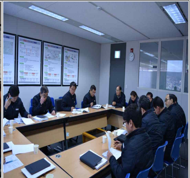
충청본부 윤리실천단회의 (10층회의실)