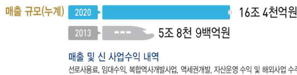
〈국가철도망 구축에 따른 지역경제 파급효과〉