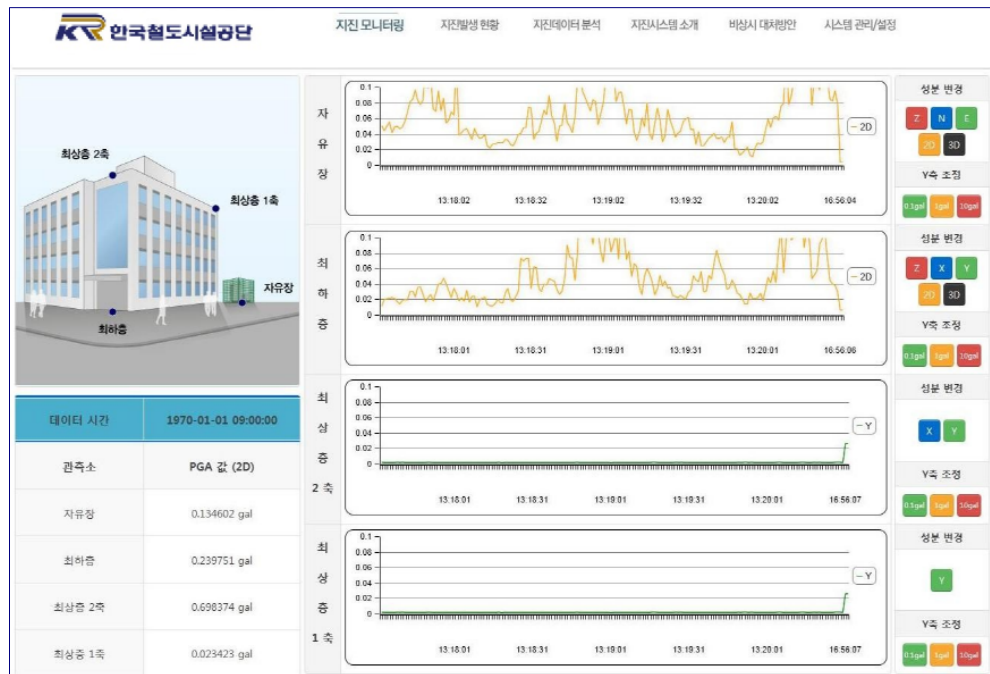
[그림 2] 역사모니터링시스템 화면구성(예시)