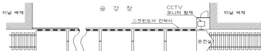
그림.1 광역철도 승강장 영상감시(CCTV) 설치 구성도

(다) 승강장 여유길이가 1m 이하인 역사의 승강장 영상감시모니터 설치 위치는 그림 1과 같다.