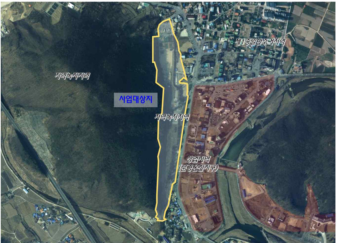
그림 2 상세도