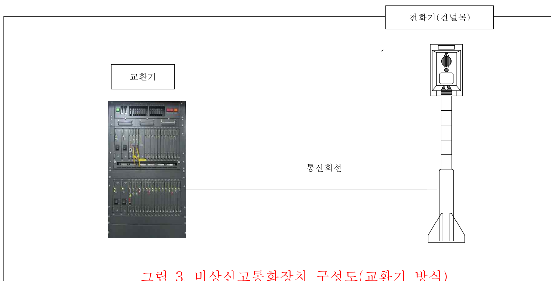
그림 3. 비상신교통화장치 구성도(교환기 방식)